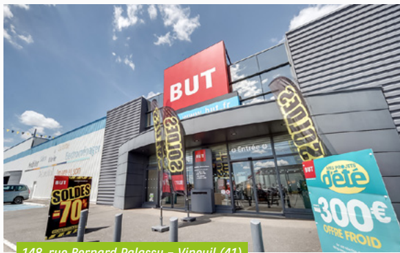
148, rue Bernard Palassy - Vineuil (41)

Au cours du 1 er semestre 2022, les 2 distributions trimestrielles réalisées sont d'un montant identique de 3,60 €/part chacune. Afin d'optimiser la distribution et préserver le niveau confortable de report à nouveau, la distribution du 2 ème trimestre comporte en partie (à hauteur de 2,50 €/part) de la plus-value réalisée au cours des arbitrages passés.